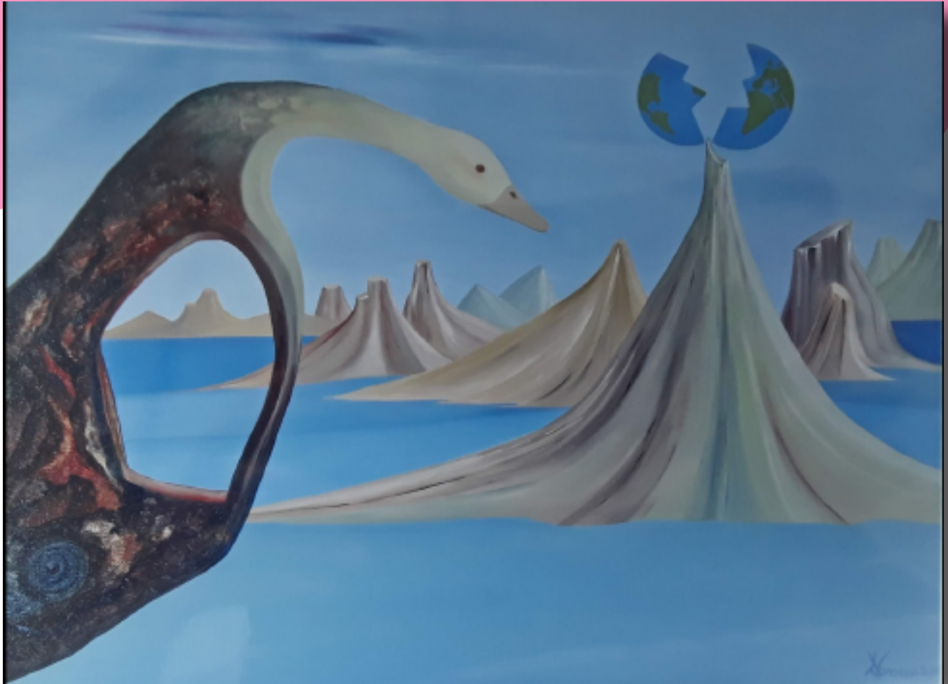
IL SOPRAVISSUTO Olio su tela, cm 80 × 60