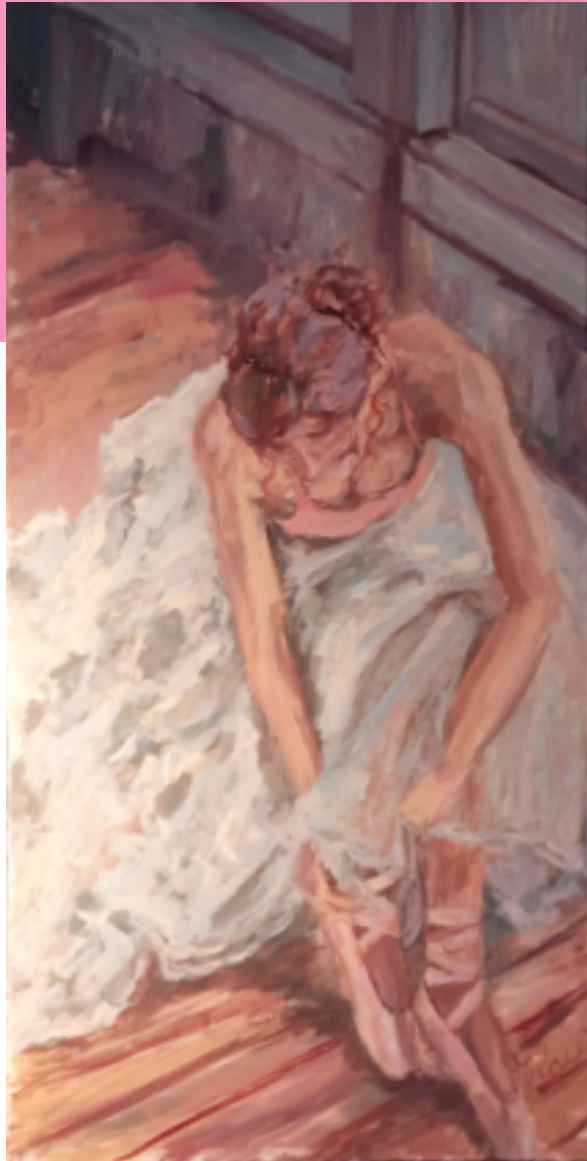
IL BALLO SOLITARIO