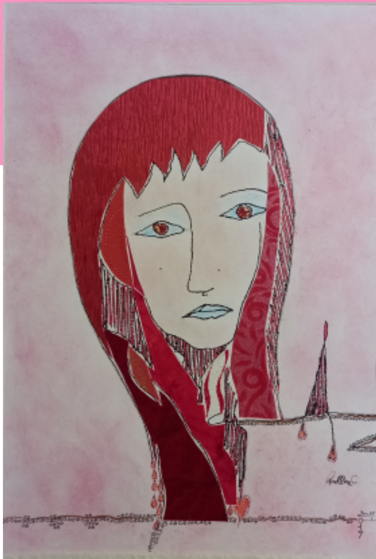
VOLTO DI DONNA

China - collage carta e pastello in carta, anno 2017