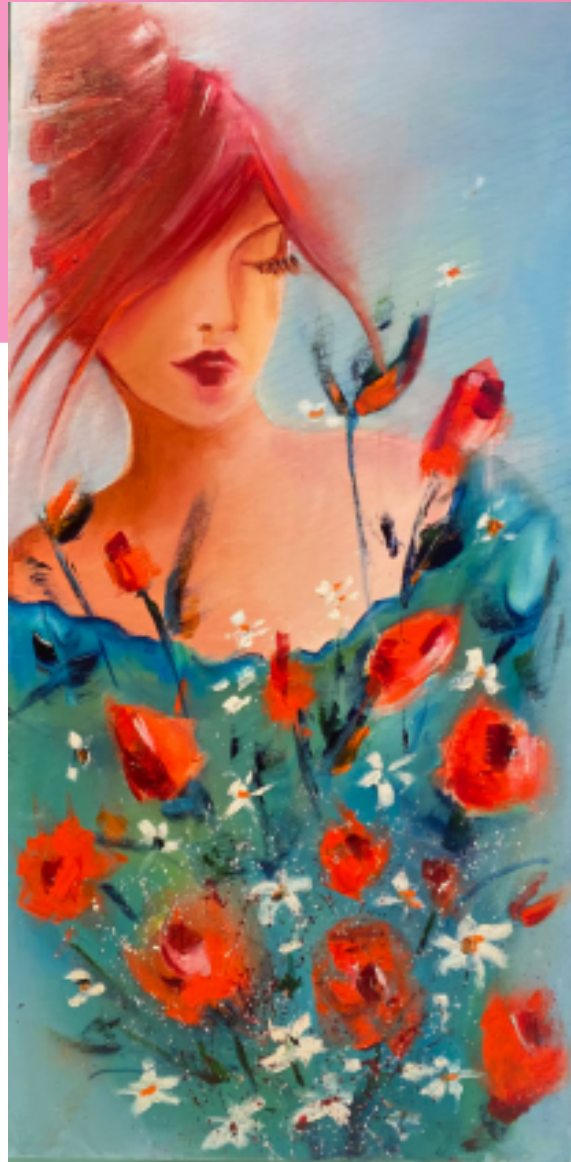
fiori. Per me!, Olio su tela, cm 30x60