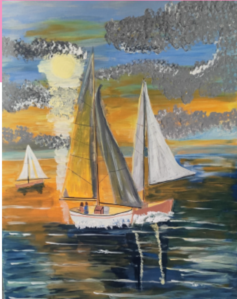
Tramonto in barca Acrilico, cm 90x100